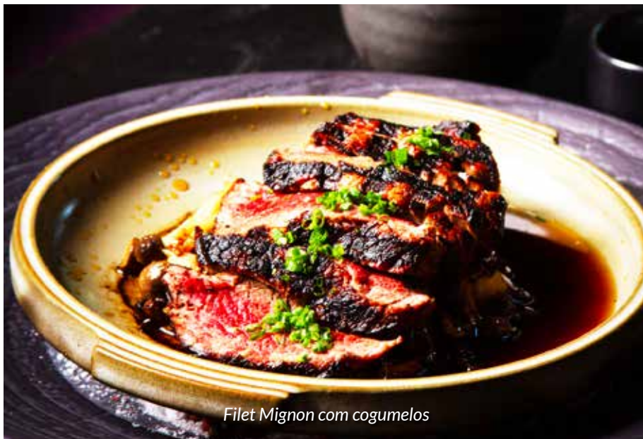
Filet Mignon com cogumelos

um prato com cogumelos, cebolinha e arroz branco. Foi uma excelente escolha.