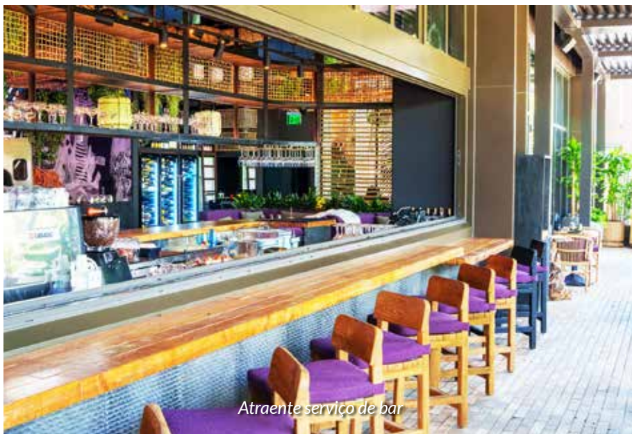
Atraente serviço de bar