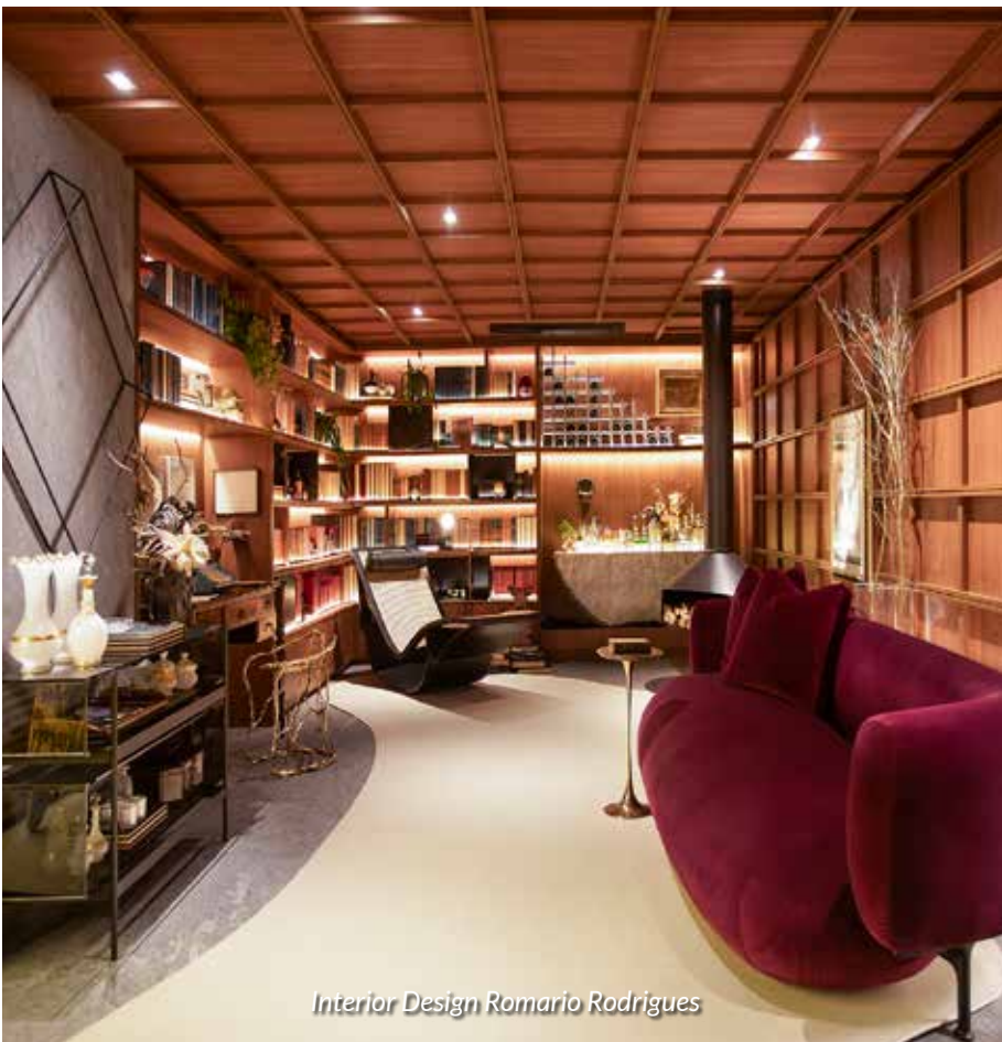
Interior Design Romario Rodrigues