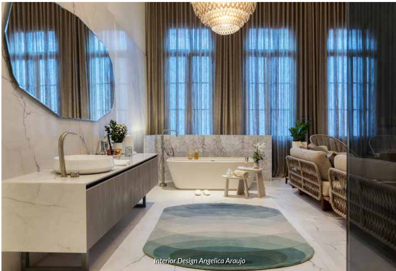
Interior Design Angelica Araujo