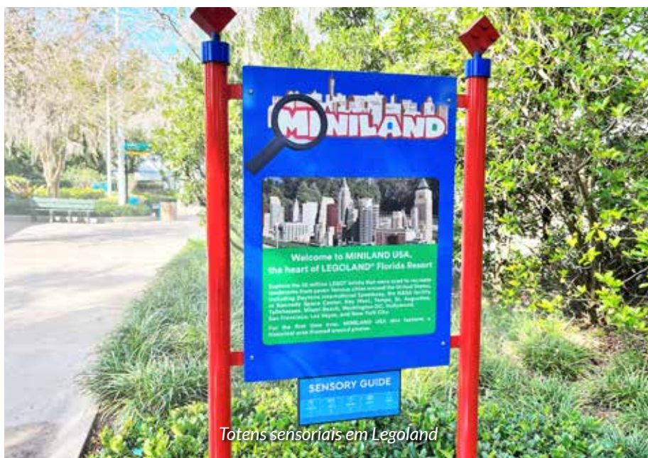
Totens sensoriais em Legoland