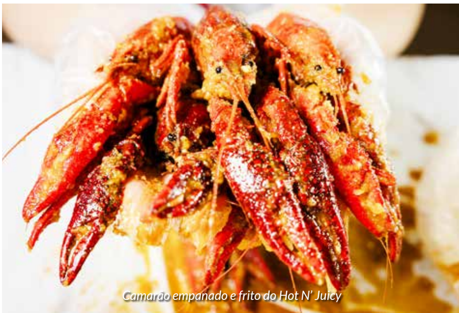
Camarão empanado e frito do Hot N' Juicy