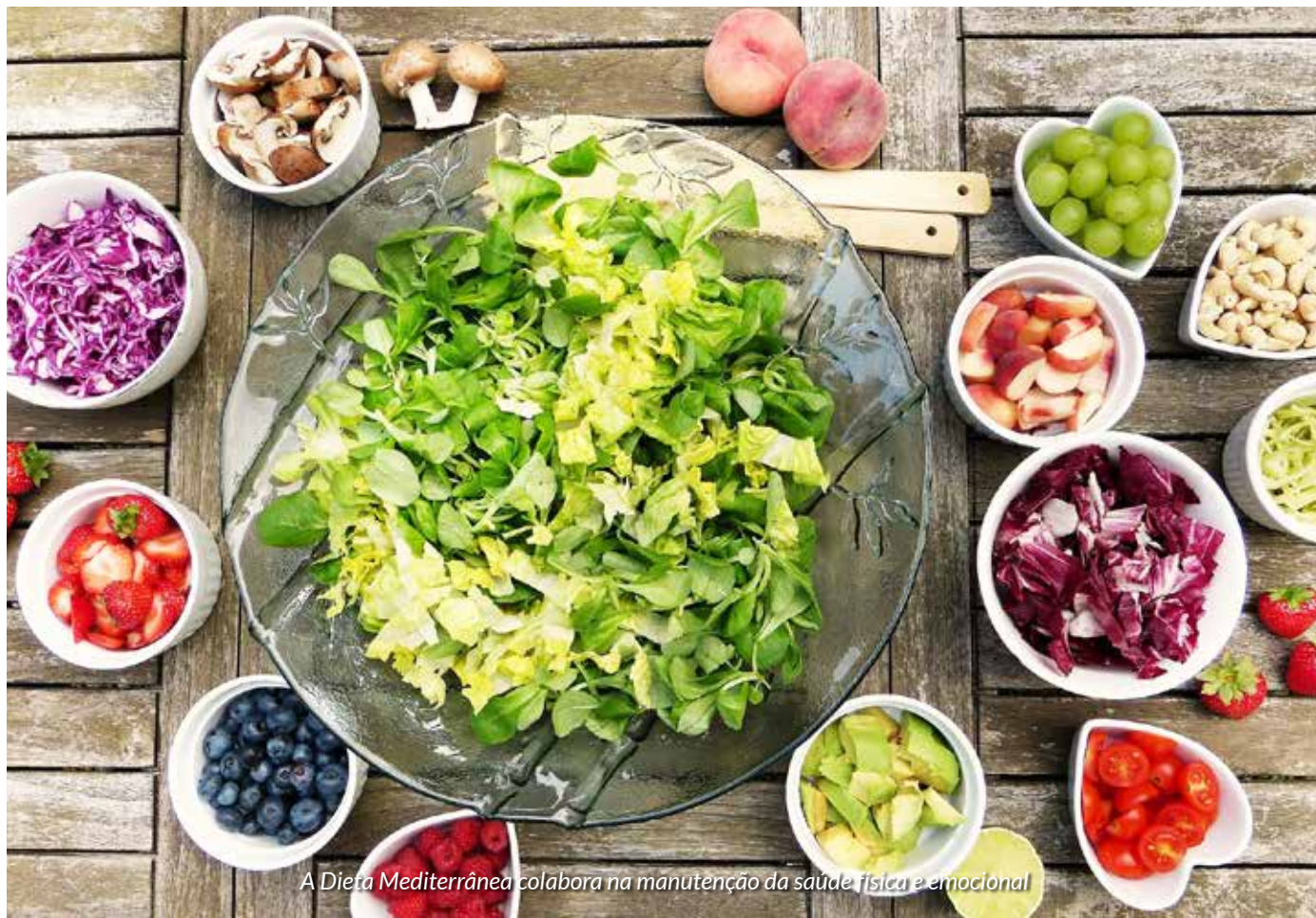
A Dieta Mediterrânea colabora na manutenção da saúde física e emocional