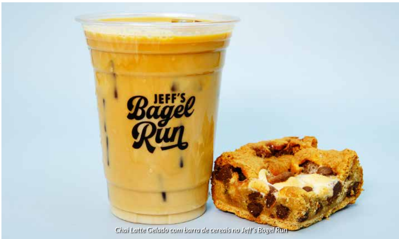
Chai Latte Gelado com barra de cereais no Jeff's Bagel Run