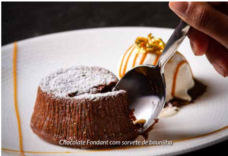
Chocolate Fondant com sorvete de baunilha

Foi muito agradável passar um final de tarde com música e dança à beira do Rio Miami. Outra novidade é o brunch de domingo, que também tem DJ e dança ao vivo.