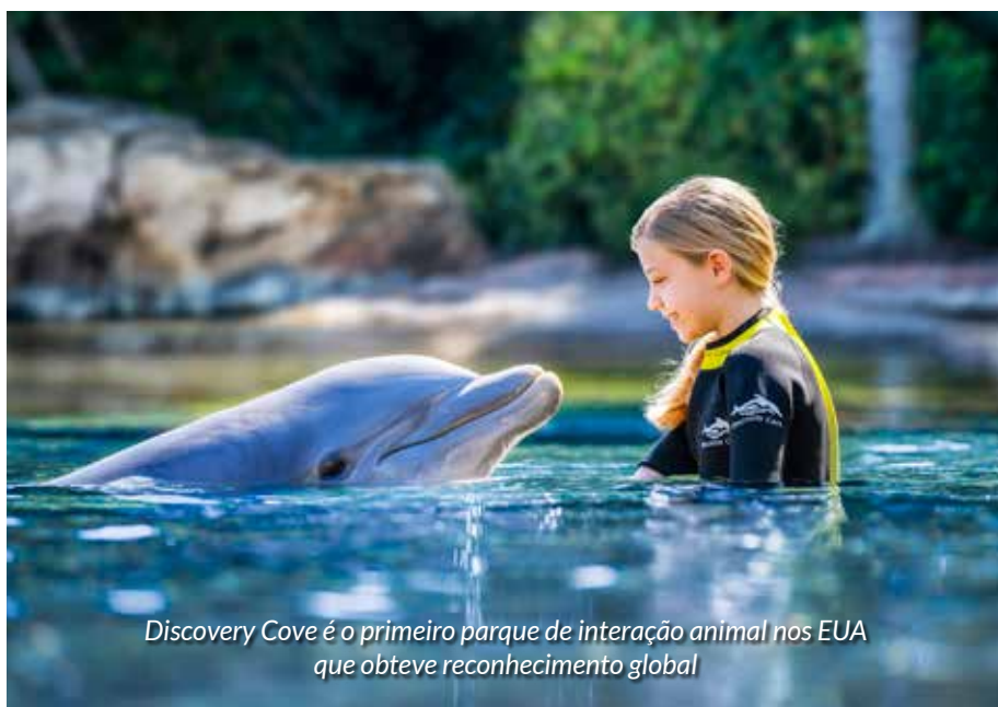
Discovery Cove é o primeiro parque de interação animal nos EUA que obteve reconhecimento global

experiências de brincadeiras sociais menos intensas. “Este parque é uma prova do compromisso do Condado de Osceola com a inclusão e com a garantia de que cada criança se sinta bem-vinda e aceita”, afirma DT, CEO de Experience Kissimmee.