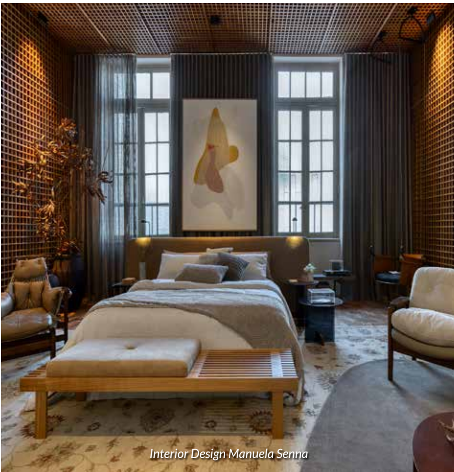
Interior Design Manuela Senna