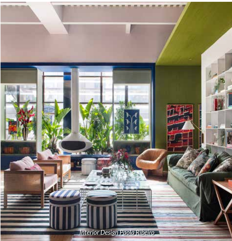
Interior Design Paola Ribeiro